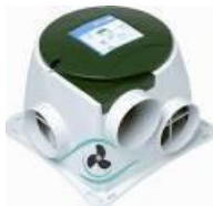
1 Mechanische ventilatie box