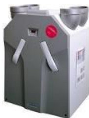
2 WTW apparaat